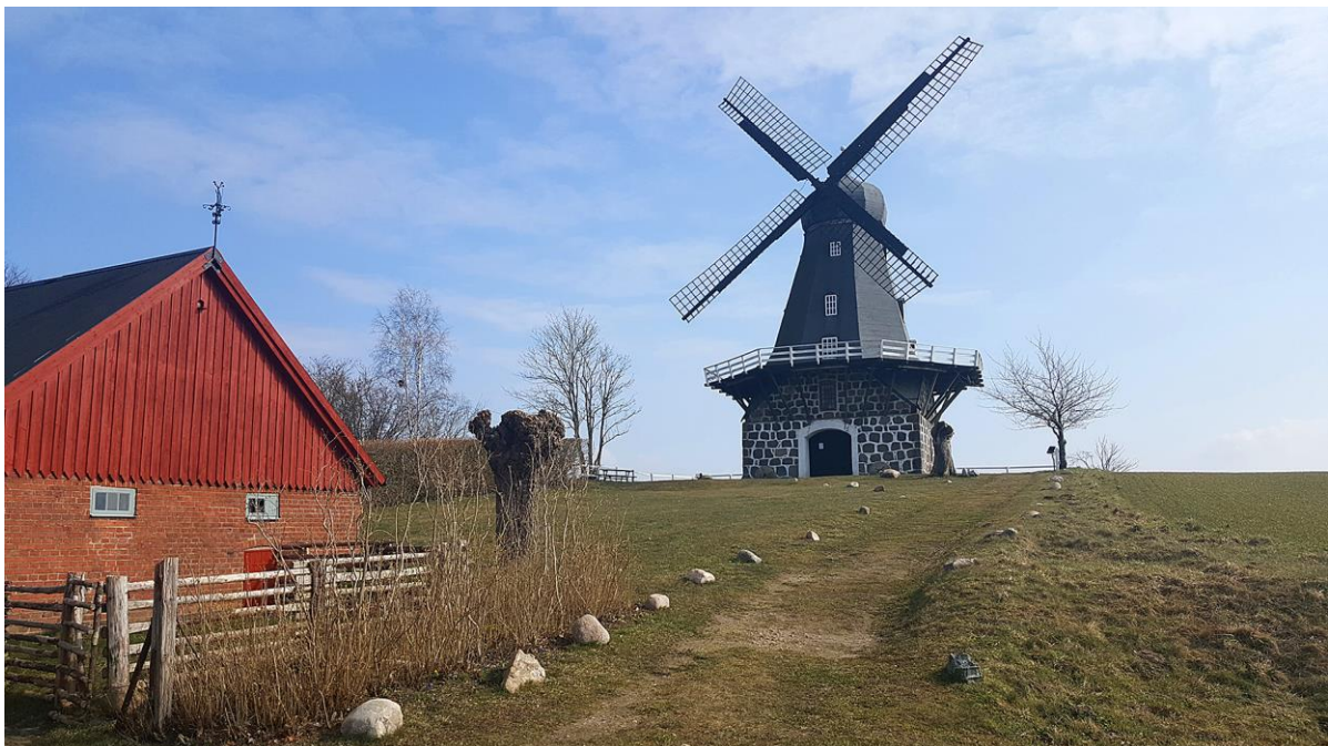
Platsen för föreningens årsmöte 2021