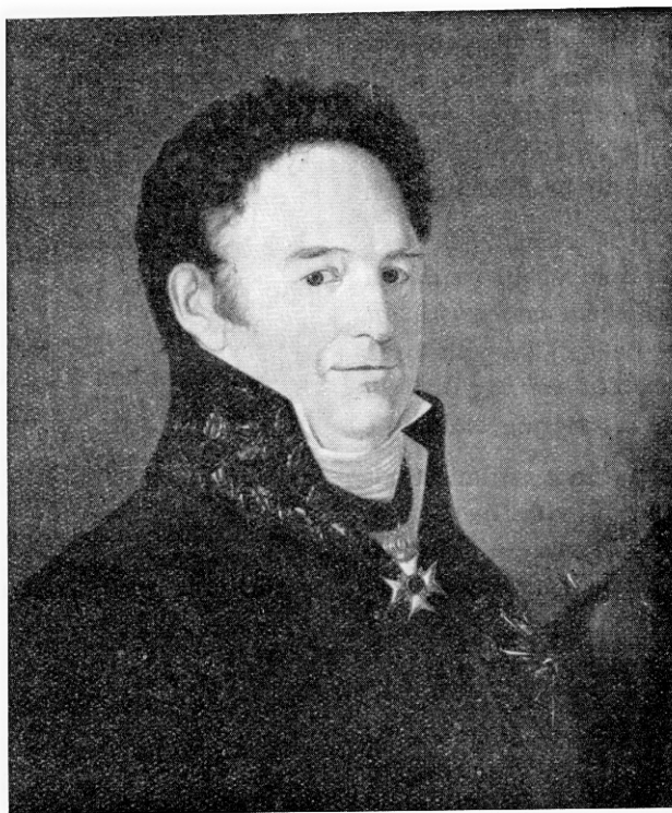
Vilhelm af Klinteberg, landshövding i Malmöhus län 1811—1829.

Landshövding Vilhelm af Klinteberg, en banbrytare på vägväsendets område.