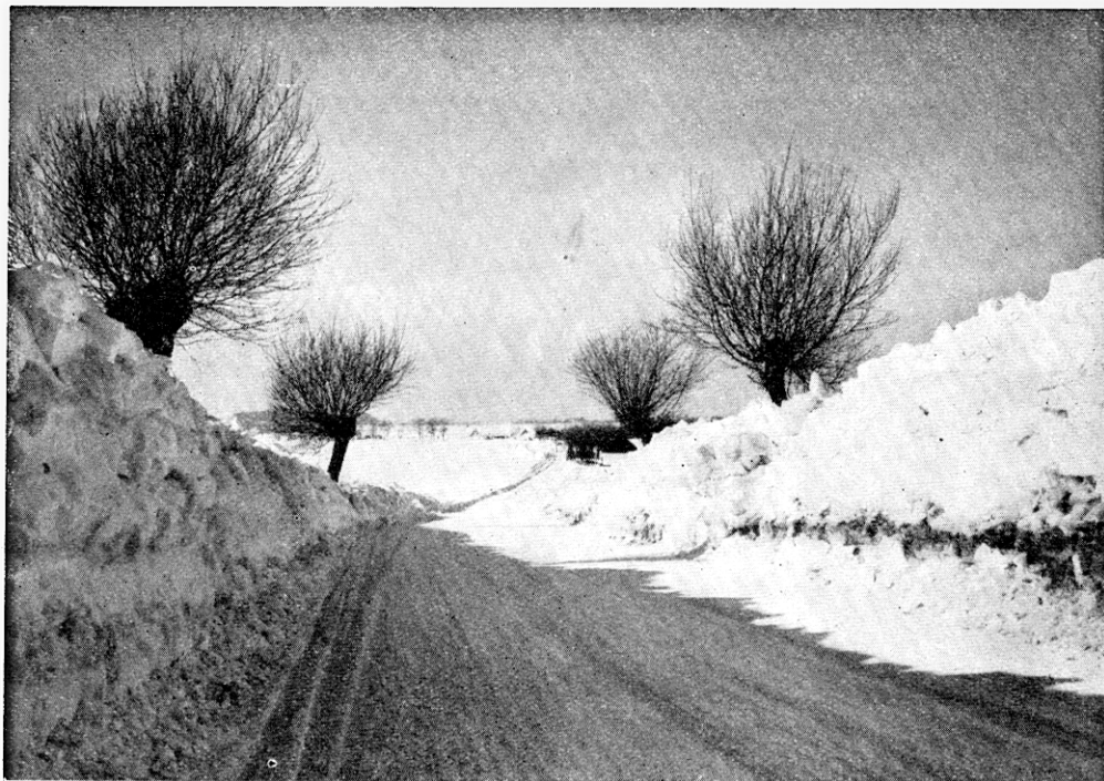
Vinterväg i Skåne, markerad av pilträde.

av dessa genom oupphörlig topphuggning så karakteristiska träd. De skånska pilträden, besjungna i en mängd dikter och återgivna i ett otal konstverk, ha ju rent av blivit något signifikativt för landskapet. Men pilträden hava också — något som kanske ej alla veta — en rent praktisk användning, i det att vidjorna användas såsom binde-medel åt lantbefolkningens halmtak. Förglömmas må ej heller den stora betydelse dessa träd hava under snöiga vintrar, då de på ett utmärkt sätt markera de i plan med den omgivande terrängen liggande skånska vägarna.