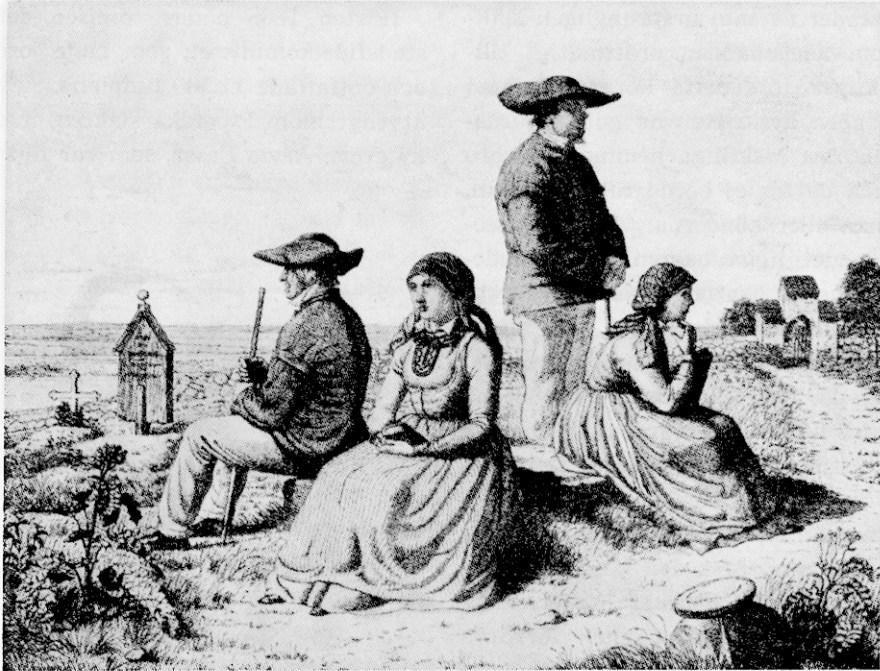
Skånska bönder. Efter en litografi av Jakob Kornerup.

förut, för att de skulle se till, att hästarna voro ordentligt skodda och vagnarna i ordning.