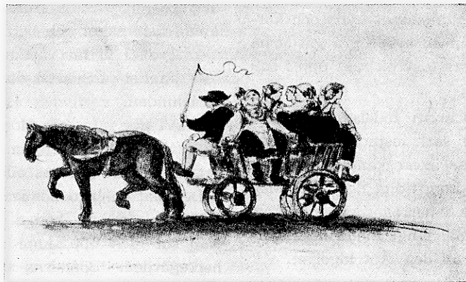
"Skånska Hofveriet hemreser."

genom sina pigor uträtta alla de fruntimmersgöromål inomhus vid herregården, som krävdes. I en tidning för år 1868 heter det om hoveriböndernas skördedagsverken: "När dessa arma bönder ha arbetat från kl. 3 på morgon till kl. 9, ja ofta till kl. 10 à 11 på natten och därefter måste lägga sig ute i markerna, enär de ofta ha långt till sina hem, äro de rent av utpinade, helst de ofta i regn och elak väderlek gå i våta kläder. De bli därför beständigt sjuka och förmå ej fullgöra sina skyldigheter vid tillsägelse. En påpasslig blodsugare, som kallas "inspektor", har då rätt att pålägga dem s. k. straffedagsverken."