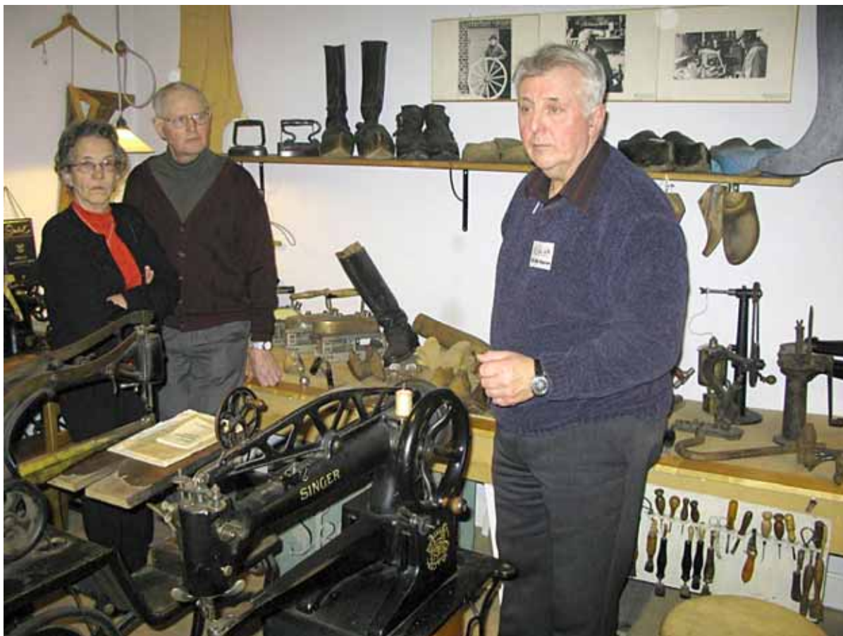
Här beser vi Åstradsgårdens samlingar av skomakerihantverk.

Måndagen den 9:e mars var det dags för vårt årsmöte 2009. Återigen blev uppslutningen rekordartad! Ett 90-tal medlemmar hade infunnit sig i lokalen på Folkets Hus och det var nätt och jämnt att alla fick plats. Vi får fundera på om vi nästa år ska boka en större lokal, framför allt en "vädringsbar" sådan, eftersom syret började tryta mot slutet av mötet. Vi glädde oss över den stora uppslutningen, men vill också be om ursäkt för att en del medlemmar endast hade fått tomma kuvert i sina brevlådor. En del hörde av sig så att vi kunde reparera missödet. Vi lovar att se över våra rutiner.