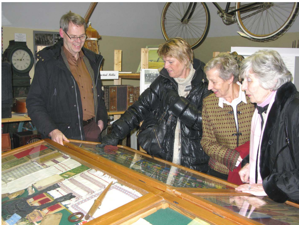
Gamla majblommor kan också ge nostalgikickar

Kvällen avslutades med kaffe i församlingshemmet intill, varvid vi blev underhållna med bildspel och diverse "historier". Vårt stora Tack till Kulturgruppen Anderslöv!