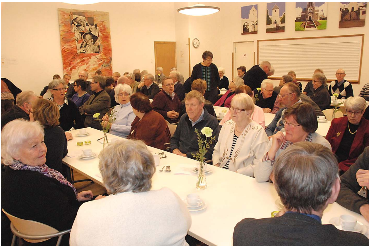
Årsmötet fyllde församlingshemmets nya samlingsal.